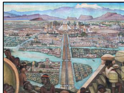
Ilustração de Tenochtitlán.

Em primeiro lugar, os espanhóis encontraram civilizações indígenas muito populosas e organizadas em estados mais centralizados , como os astecas (no atual México) e os incas (nos atuais Peru e Bolívia). Inclusive, os próprios conquistadores espanhóis ficaram maravilhados com a complexidade das sociedades locais, especialmente com a cidade de Tenochtitlán , a capital do Império Asteca. Naquela época, a cidade asteca era tão grande que rivalizava, ou até superava, os principais centros urbanos europeus em tamanho e organização!