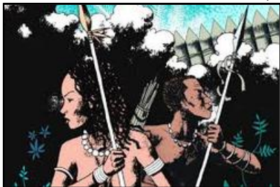
Cena de Angola Janga, de Marcelo D'Saete.

Quanto à população, as comunidades de Palmares começaram a crescer no início do século XVII (anos 1600) e, já na década de 1640, abrigavam cerca de 6 mil pessoas. Na década de 1690, Palmares alcançou seu auge, com cerca de 20 mil moradores, incluindo muitos que já eram da terceira geração nascida no quilombo.