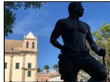
Estátua de Zumbi dos Palmares.

Texto adaptado da obra “Escravidão no Brasil”, por Francisco Vidal Luna e Herbert S. Klein.