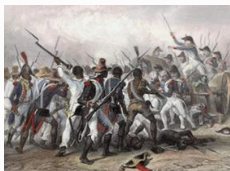
Ilustração de um combate entre tropas francesas e haitianas durante a Revolução Haitiana. Extraída de Histoire de Napoléon , de M. De Norvins, 1839.

A revolta começou mesmo do dia 14 de agosto, nas plantações do norte da colônia, onde muitos escravos se uniram para lutar contra os fazendeiros e seus opressores. Na luta, fazendas inteiras foram queimadas e muitos proprietários de escravos foram mortos em vingança. Os escravos estavam cansados do tratamento desumano e queriam sua liberdade imediata.