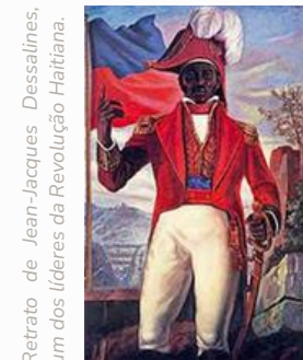
Retrato de Jean-Jacques Dessalines, um dos líderes da Revolução Haitiana.

A disputa continuou até 1804, quando o Haiti finalmente conquistou sua independência e se tornou o primeiro país das Américas a abolir a escravidão de forma definitiva. Por ser a mais bem sucedida revolução escrava de toda a história, a Revolução Haitiana foi um marco na luta pela liberdade e pelos direitos humanos.