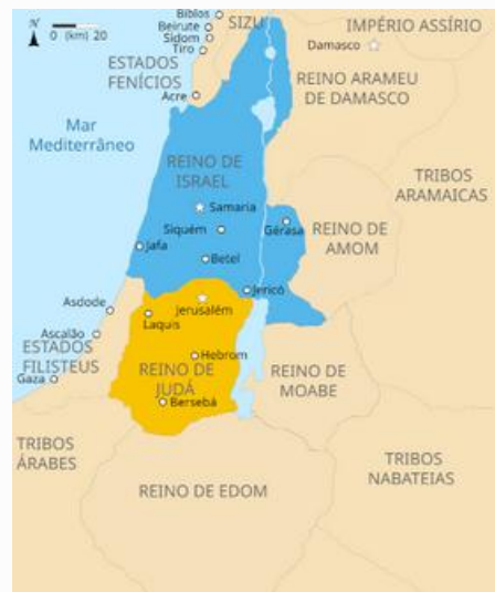
Mapa que ilustra os reinos de Judá e de Israel na Palestina.

A história dos antigos hebreus só terminou com a invasão romana na Palestina, em 70 d.C. Após o domínio romano, os hebreus viveram a "diáspora", dispersando-se pelo mundo.