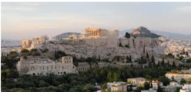
Acrópole de Atenas

Agora e asty: Parte baixa da cidade, onde residiam seus habitantes. O mercado e a praça pública também eram importantes espaços dessa área da cidade.