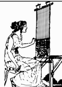
Aracne, a tecelã

Athena, disfarçada de velha, foi até Aracne e tentou avisá-la sobre sua arrogância, dizendo que ela deveria ser mais humilde. Aracne ignorou o conselho e desafiou Athena para uma competição de tecelagem. Ambas teceram lindos tapetes: Athena teceu imagens dos deuses em toda a sua glória e poder, enquanto Aracne retratava os erros e falhas dos deuses, o que deixou Athena furiosa.