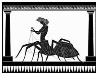
Aracne transformada em Aranha.

Apesar do talento de Aracne, seu desrespeito foi demais para Athena. Furiosa, a deusa rasgou o trabalho de Aracne e, como punição, transformou-a em uma aranha. Desde então, Aracne e seus descendentes continuam a tecer teias, lembrando a todos da importância de ser humilde.