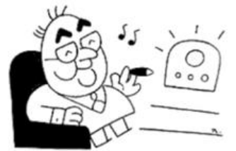
Caricatura de época mostrando Getúlio Vargas ouvindo o rádio.

O rádio ajudou Getúlio Vargas a se tornar mais popular, pois permitia que ele falasse diretamente com a população, mesmo nas áreas mais distantes do país. Assim, o rádio divertia as pessoas e também ajudava na divulgação de informações importantes. Até hoje, o rádio é um meio de comunicação muito querido e usado por muitos brasileiros.