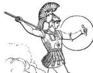
Marte, o deus da Guerra.

A primeira vem das lendas e da mitologia romana. Os romanos acreditavam que eram descendentes de Rômulo, filho de Marte, deus da guerra, e de Réia Sílvia, filha do rei de Alba Longa.