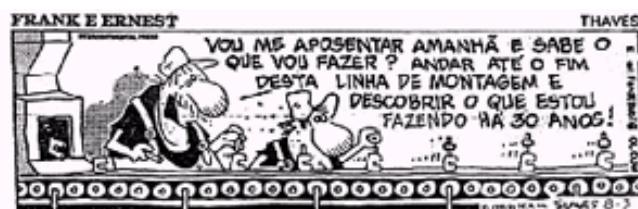
Jornal do Brasil, 19 de fevereiro de 1997.

SMITH, Adam. A Riqueza das Nações . Investigação sobre a sua Natureza e suas Causas. Vol. I. São Paulo: Nova Cultural, 1985.