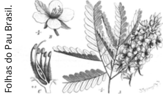
Folhas do Pau Brasil.

Aí entra uma árvore do Brasil que os portugueses exploraram lá pelos anos de 1500: o Pau-Brasil. Essa árvore tem uma cor vermelha bem bonita, então os portugueses começaram a cortá-la na mata brasileira e levar para a Europa, onde usavam para fazer tinta. Eles tinham roupas tingidas com essa tinta e vendiam na Europa por um preço bem alto!