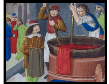
Tingimento de tecidos na Idade Média.

Mas sabia que antigamente não era tão fácil ter roupas coloridas? Na época da Idade Média, por exemplo, as roupas geralmente tinham cores meio cinzas ou um pouco marrons ou amareladas, porque tingir roupas era muito difícil e caro.