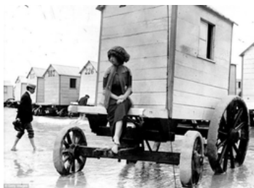
Cabinas de mergulho, muito populares no século 19.

2) Leia o texto abaixo e resolva as atividades.