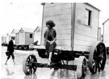
Cabines de mergulho, muito populares no século 19.

2) Leia o texto abaixo e resolva as atividades.