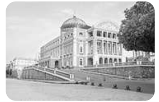
Teatro Amazonas, em Manaus (AM).