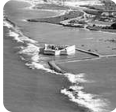
Forte dos Reis Magos, no Rio Grande do Norte.