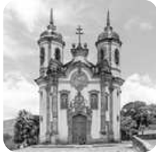
Igreja São Francisco de Assis, em Ouro Preto (MG)