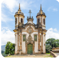
Igreja São Francisco de Assis, em Ouro Preto (MG)