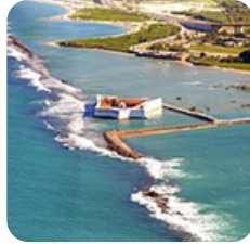
Forte dos Reis Magos, no Rio Grande do Norte.